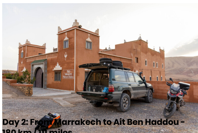
Day 2: From Marrakech to Ait Ben Haddou - 180 km / 111 miles

Hoy recorreremos la carretera que asciende al Tizi n'Tichka, un increíble paso a 2260 metros, a lo largo de una de las carreteras más hermosas del mundo. Luego pasaremos por la magnífica Kasbah de Telouet, donde haremos una breve visita. Continuaremos por caminos muy característicos, ascendiendo por las montañas del Atlas, por donde pasaban las caravanas que intercambiaban mercancías. Llegaremos a Ait Ben Haddou, donde cenaremos y pasaremos la noche en un típico